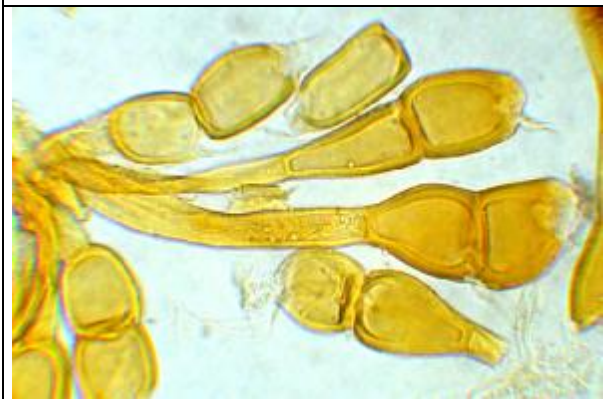
Téleutospores colorées au Melzer