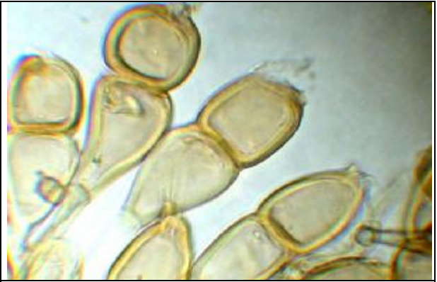
Téleutospores observées dans l'eau