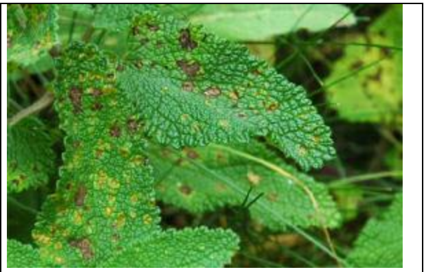
Taches sur les feuilles indiquant la présence de sores à la face inférieure