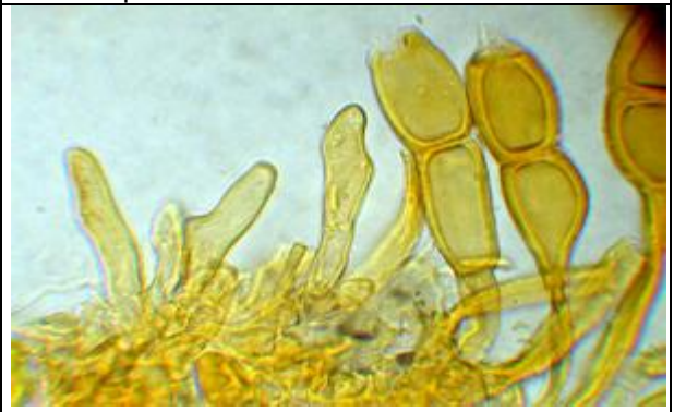
Téleutospores colorées au Melzer + hyphes génératrices