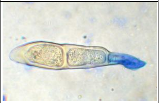
Détail de téléutospore colorée au BCoton