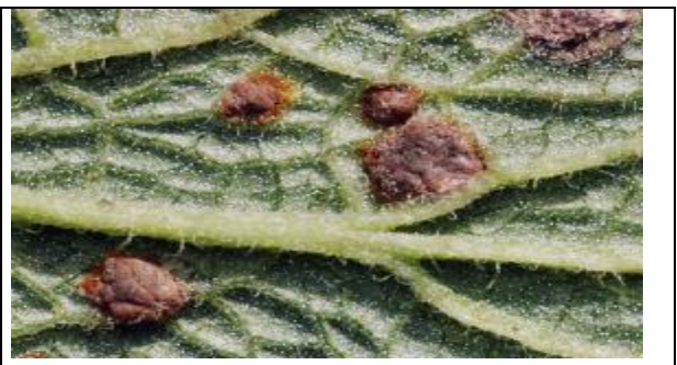
Sores à téléutospores, foliicoles, roux à brunâtre clair, compacts et non pulvérulents