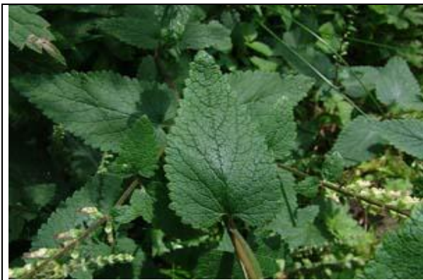
Détail de la feuille