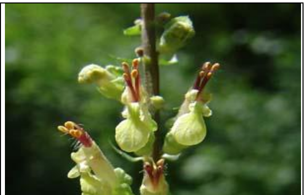
Détail de la fleur